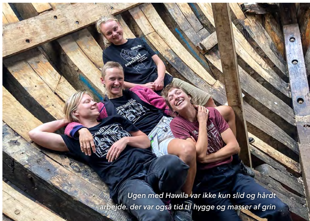
Ugen med Hawila var ikke kun slid og hårdt arbejde, der var også tid til hygge og masser af grin

Tanken er, at sejlskibet Hawila skal være et bæredygtigt alternativ til store