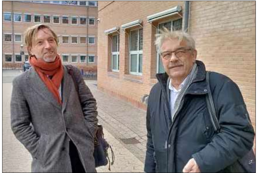
Retten i Glostrup.

Steen blev oprindeligt udlært som murer, men allerede den gang stod det hurtigt klart, at det