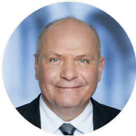
Søren Gade (V) - er opstillet for Venstre til det kommende Folketingsvalg

Tre danske Europa-Parlamentarikere er opstillet til det kommende Folketingsvalg. I tilfælde af, at de vælges, udtræder de af Europa-Parlamentet, da man ikke kan sidde i Folketinget og Europa-Parlamentet samtidigt.