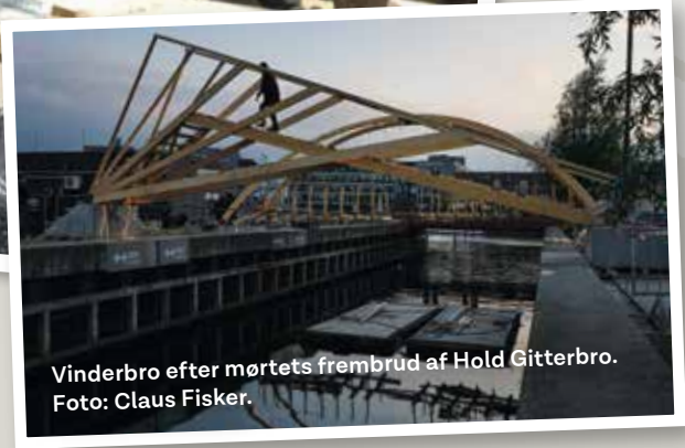
Vinderbro efter mørtets frembrud af Hold Gitterbro.

Formålet med Verdens vildeste Brobyggere er at skabe opmærksomhed om erhvervsuddannelserne.