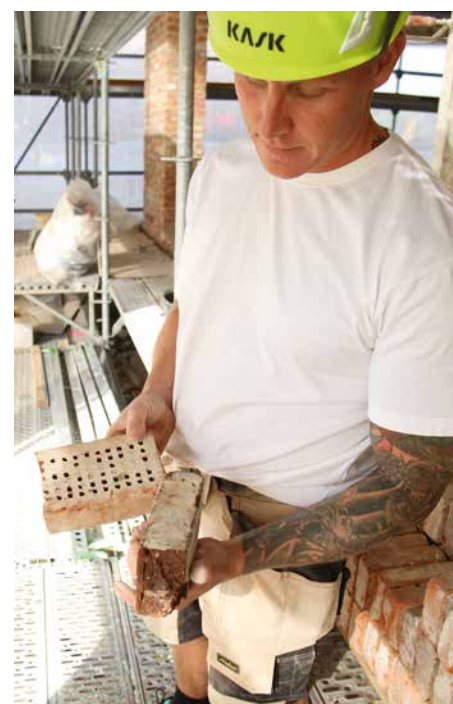
Alt skal i, lyder det fra byggeledelsen. Her en meget lerholdig og hård sten samt en "cellesten".

Genbrugsstenene har nok en overraskelse i ærmet. Nogle kommer fra et byggeri i Søborg. Andre er fra et posthus i Odense, mener sjakket at vide. Endelig er nogle fra genbrugspladser i Horsens. De er ikke lige store. Nogle er 24 cm lange og 11 cm brede. Nok forstørrelse til, at det driller. Særligt i hjørner.