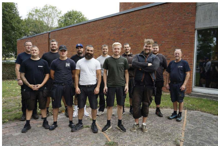
Nye tagdækkersvende fra Learnmark Horsens