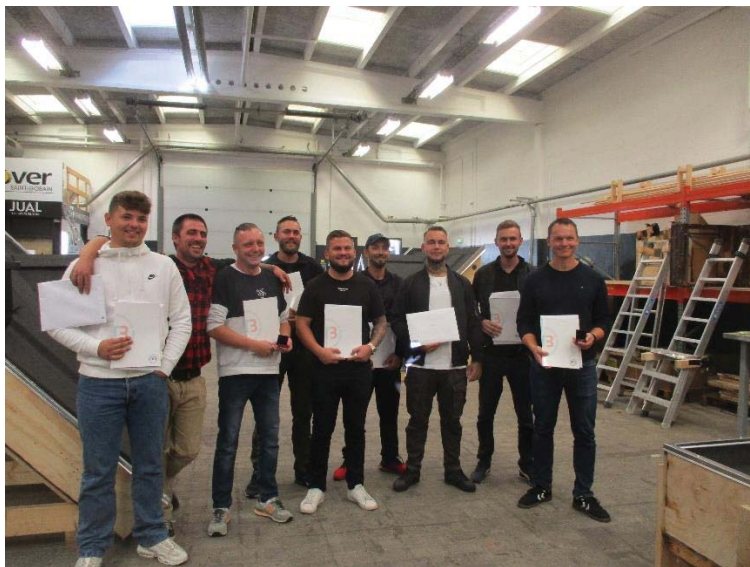
Nye tagdækkersvende fra EUC Nordvestsjælland Audebo

Tagdækkernes Landsklub ønsker efterårets nye tagdækkersvende TILLYKKE med svendebrevet