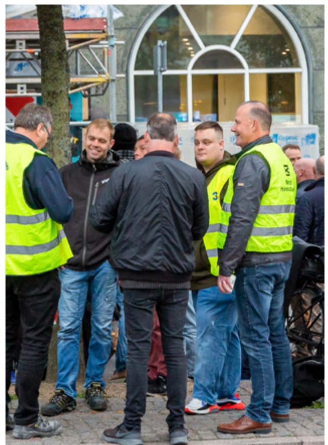
Sympatikonflikt blev sejrsmiddag med rundstykker og morgenkaffe foran Grand Hotel på Vesterbro.